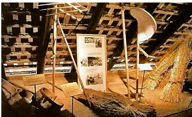
Arbeitsgeräte zur Ernte des Dinkels