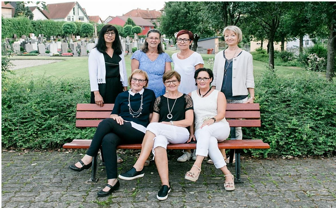
Das Foto zeigt die Vorstandsmitglieder der kfd Altheim im Jubiläumsjahr 2017 bei der Übergabe der Bänke auf dem Vorplatz der Friedhofskapelle.

Ein großes Anliegen, das nicht nur die kfd Altheim beschäftigt, ist der Mangel an Nachwuchs. Die Altersstruktur ist sehr hoch, da leider wenig junge Frauen den Wunsch verspüren, sich in einem Verband zu organisieren. Dabei ist die kfd kein „Kaffeeklatsch-Verein“, sondern setzt sich klare Ziele z.B. auch im Hinblick auf politische Mitverantwortung. Diese zeigt sich u.a. beim Einsatz für die gleichberechtigte Beteiligung von Frauen an Entscheidungen in Gesellschaft, Kirche, Politik und Wirtschaft. Auch sieht sich der Verband in der Pflicht, für Menschenwürde und Gerechtigkeit aller Menschen weltweit einzutreten und kämpft für demokratisches Handeln in Kirche und Gesellschaft.