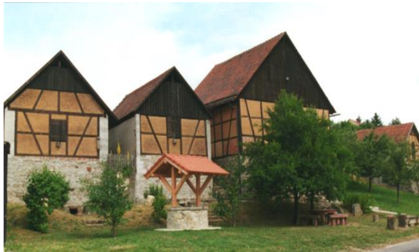
Unter Denkmalschutz stehende Darrenstraße am Grünkernradweg

Die Auszeichnung „Bürgerpreis 2017“ der Denkmalstiftung Baden-Württemberg gibt Anlass, einmal Rückschau zu halten, was der Heimatverein in den über 30 Jahren seines Bestehens geleistet hat. Nach dem Motto „Bürger retten Denkmale“ haben die Mitglieder des Heimatvereins ein herausragendes Engagement im Denkmalschutz bewiesen und sich im Gemeinschaftsleben von Altheim bestens eingebracht.