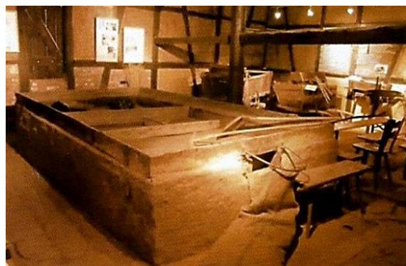
Dörrblech zur Röstung des Dinkels

Tauchen Sie darum mal wieder mit uns ein in die Welt unserer Vorfahren und besuchen Sie unser Grünkernerdarrenmuseum. Wir freuen uns auf Sie!